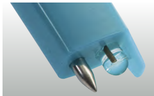
testo 206-pH1: hlavice sondy pH1 pro tekutiny