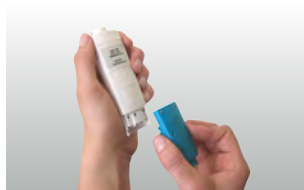
Možnost jednoduché výměny sond u testo 206-pH1/-pH2/-pH3