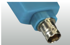
testo 206-pH3: hlavice sondy pH3 s rozhraním BNC