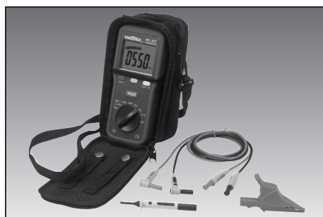
Příslušenství (obsah dodávky)