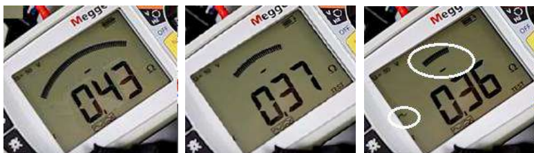
Úvodné meranie (4sek)

Nový Indikátor spoľahlivosti merania impedancie vypínacej slučky v podobe oblúkového bargrafu priebežne počas merania indikuje spoľahlivosť výsledku a mieru vplyvu rušenia na výsledok. Pri zarušenom obvode a nestabilnom výsledku automaticky indikuje prítomnosť rušenia, vykoná korekciu, až po dosiahnutie stabilného spoľahlivého výsledku (oblúkový bargraf sa zminimalizuje).