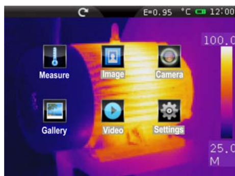
Hlavní menu s ikonami

THT70 model je moderní infračervená kamera s kapacitní dotykovou obrazovkou TFT a barevným displejem pro rychlé a intuitivní ovládání