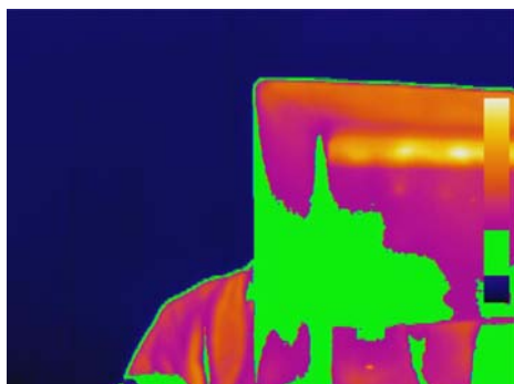
Pokročilá analýza: funkce isotherm