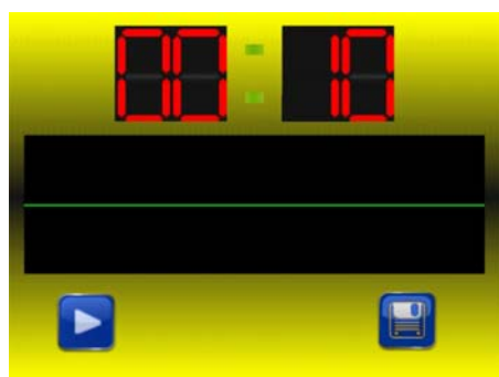
Vytváření IR videa