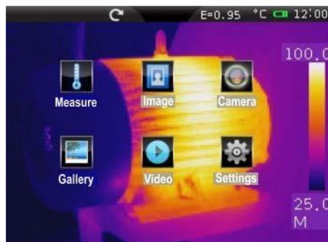
Obecná nabídka s ikonami

Model THT60 je profesionální infračervená kamera s barevnou kapacitní dotykovou TFT obrazovkou pro rychlé a intuitivní pokročilé použití jakýmkoliv termografickým operátorem