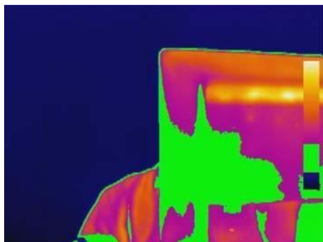
Pokročilá analýza: Funkce Isotherm