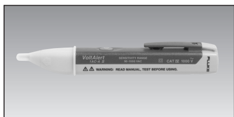
Fluke 1AC VoltAlert