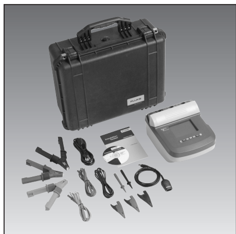
Příslušenství verze /KIT